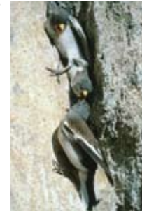
Sur environ 19'000 couples de Niverolles alpines présentes en Europe, 4'000 nichent en Suisse; nous sommes donc responsables de la conservation de cette espèce.

Les espèces importantes pour la Suisse sont plus nombreuses dans les IBA que partout ailleurs. Il est donc indispensable de maintenir au moins la stabilité des effectifs dans les IBA. Ainsi, la Suisse peut permettre de garantir à long terme la survie de ces espèces.