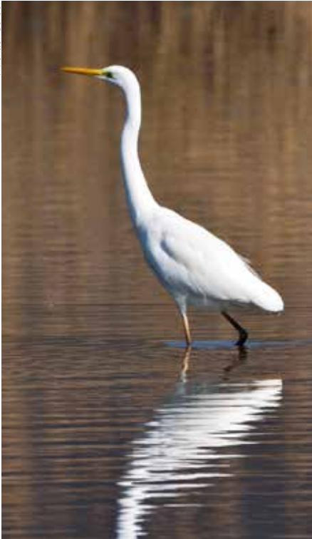
Immer ein gern gesehener Gast: der Silberreiher.

für Familien vorbereitet. Dabei kann die gefährvolle Reise der Vögel hautnah mitverfolgt werden. Und natürlich kann man die Vögel im Neeracherried auch live sehen: Am Flachteich zeigen sich erfahrungsgemäss Bekassine, Silberreiher, Eisvogel und viele weitere Zugvögel und Wintergäste.