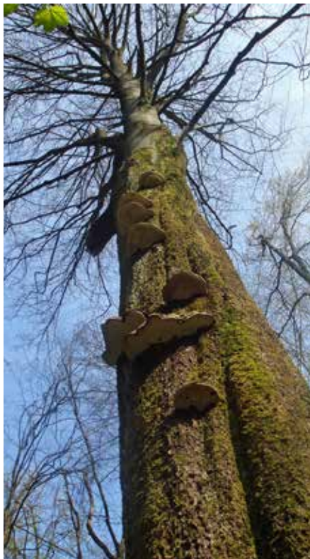
Solche Biotopbäume sollten kartiert und danach stehen gelassen werden.

rung von Bäumen (nur in Absprache mit dem Förster!) ist beim SVS/BirdLife Schweiz eine Spechtschablone erhältlich.