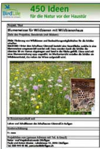
Der SVS möchte 450 Ideen für mehr Natur im Siedlungsraum zusammentragen.