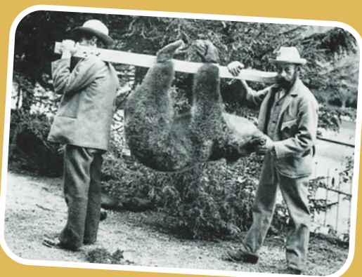
IM JAHR 1904 SCHOSSEN JÄGER DEN LETZTEN SCHWEIZER BÄREN AB.

In der Schweiz wurde der Bär früher stark verfolgt. So kam es, dass Jäger vor über hundert Jahren den letzten Bären abschossen! Danach wurde für lange Zeit kein Bär mehr gesichtet. Erst vor 15 Jahren begannen ab und zu wieder einzelne Tiere einzuwandern. Sie stammen aus einem Wiederansiedlungs-Projekt in Italien nahe der Grenze. Die meisten Bären, die in die Schweiz kamen, waren scheu und lebten versteckt. Zwei jedoch zeigten nur wenig Scheu und näherten sich den Dörfern. Einige Leute hatten Angst. So entschied man sich, diese beiden Bären abzuschliessen.