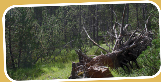
WILDE WÄLDER FÜR DEN BÄREN GIBT ES IN DER SCHWEIZ GENUG.