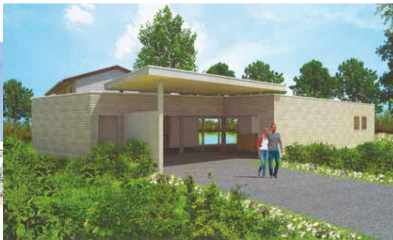
Die beiden neuen Naturzentren, an deren Aufbau BirdLife Schweiz beteiligt ist: links Pfäffikersee, rechts Klingnauer Stausee