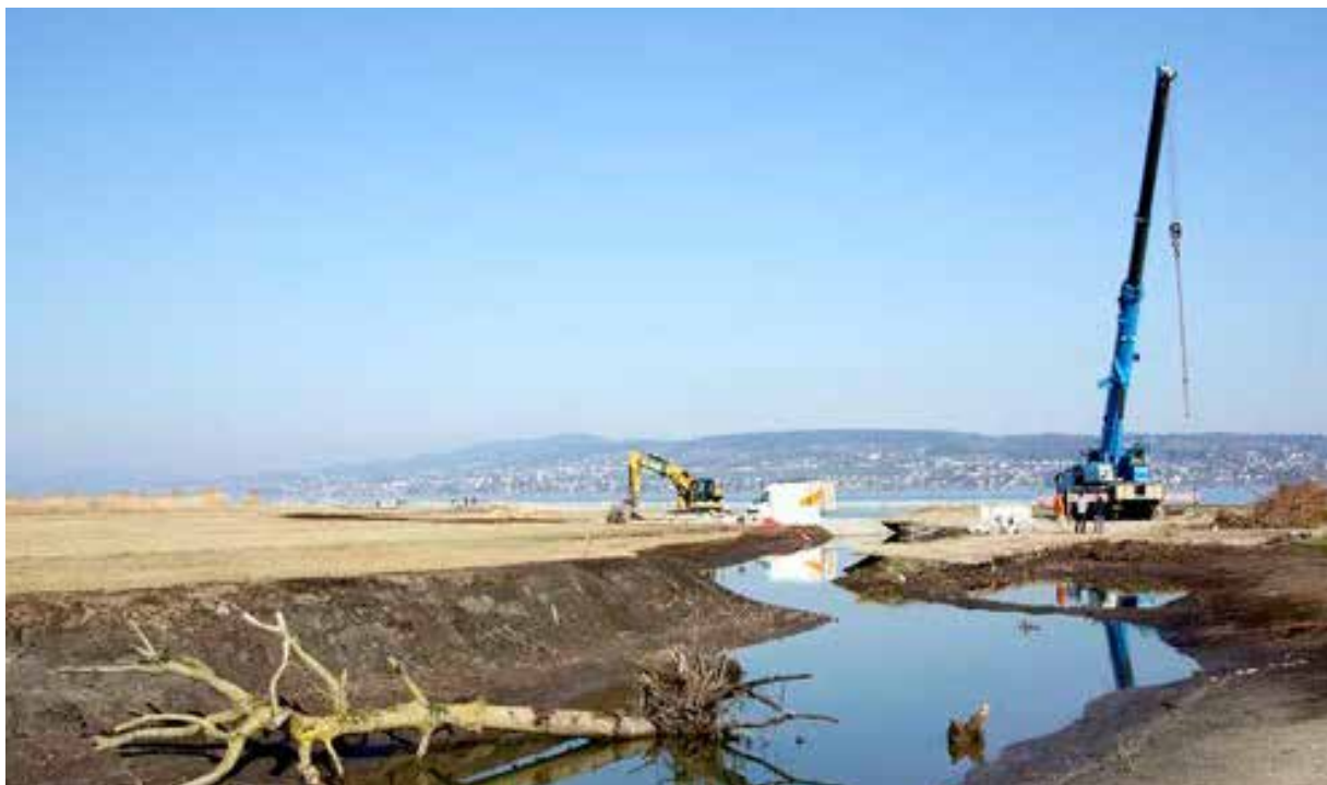
Die Arbeiten am Projekt Pfäffiker Ried II am Frauenwinkel SZ.

Die BirdLife-Mitgliedorganisationen , darunter viele lokale Sektionen und Kantonalverbände, betreuen zusammen über 1200 Schutzgebiete . Die Landesorganisation Ala ist Betreuerin von 16