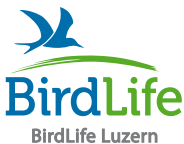
LU: BirdLife Luzern