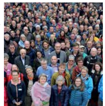
Konzept BirdLife Schweiz und sein Netzwerk 2030

Das Konzept 2030 muss nun konkretisiert und umgesetzt werden. Dazu wird 2018 ein Prozess der Organisationsentwicklung gestartet.