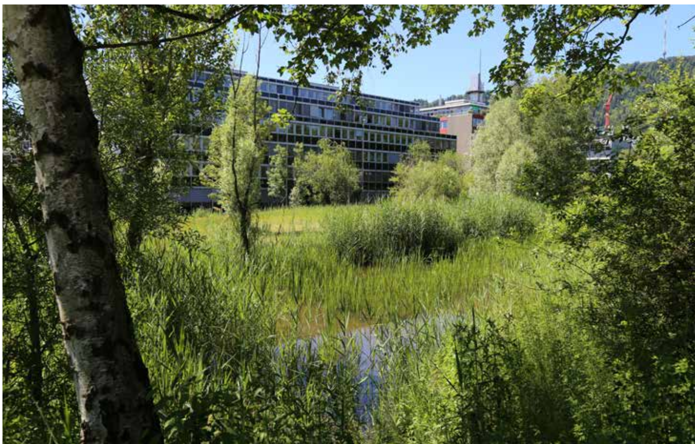
Wasser im Siedlungsraum bildete den dritten Schwerpunkt der BirdLife-Kampagne «Biodiversität im Siedlungsraum: Natur vor der Haustür».