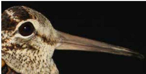
Die Jagd auf die Waldschnepfe ist umstritten.

Im Frühling 2017 verurteilte das Bezirksgericht Bülach einen Taubenzüchter, der es mit einer vergifteten Locktaube auf den Wanderfalken abgesehen hatte. Er hatte den Fall an das kantonale Verwaltungsgericht weitergezogen, doch dieses bestätigte die Verurteilung im Dezember.