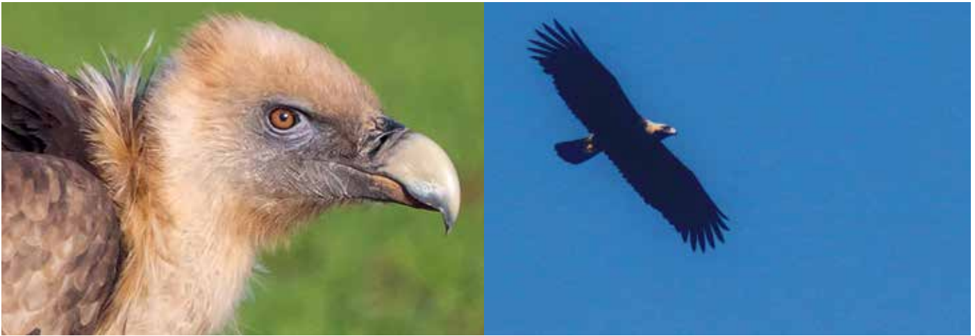
Der Schutz von Greifvögeln (links Gänsegeier, rechts Kaiseradler) war ein Schwerpunkt der BirdLife-Arbeit.