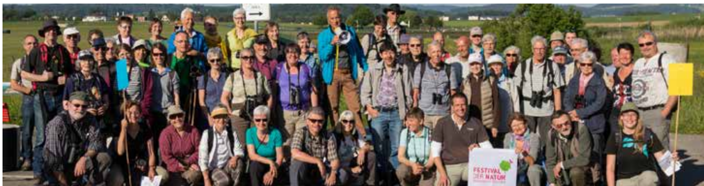
BirdLife Schweiz hat das Festival der Natur in die deutsche und italienische Schweiz gebracht (Bild: Anlass organisiert vom NVV Winkel, in Zusammenarbeit mit dem NV Bülach und NV Kloten).

Kantons, Kurse in Naturschutz oder Biodiversitätsberatung anzubieten.