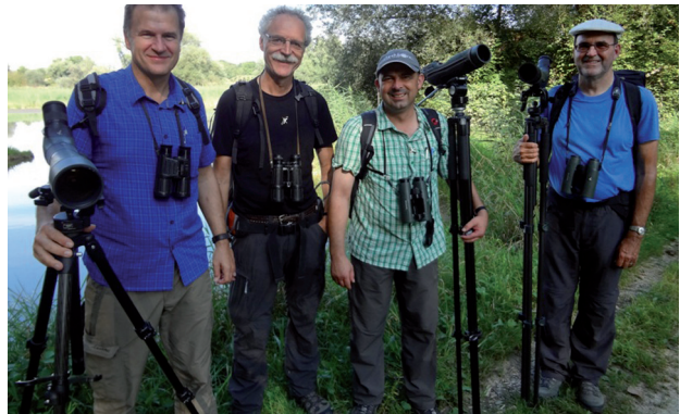
Die Chlapperstörche 2013