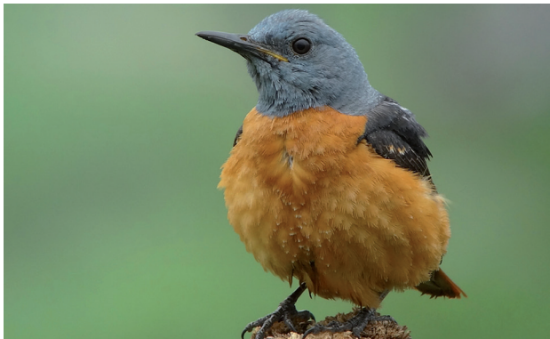
Steinrötel (U. Kägi)

Angesichts der fortgeschrittenen Zeit beschlossen wir, den Veloausflug in die Thuner Allmend sausen zu lassen und fuhren auf direktem Weg nach Koblenz, von wo aus wir ab 15.30 Uhr den Klingnauer Stausee von unten aufrollten. Wir erfreuten uns am gesamten Entensortiment