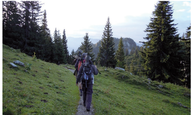
Abstieg von der Oberstockenalp (P. Bürgi)

Ob es am tollen Wetter lag oder doch vielleicht an unseren neuen Team-Chäppis? Wir sind jedenfalls stolz auf unsere Leistung, bedanken uns bei allen Spenderinnen und Spendern und freuen uns aufs nächste Jahr!