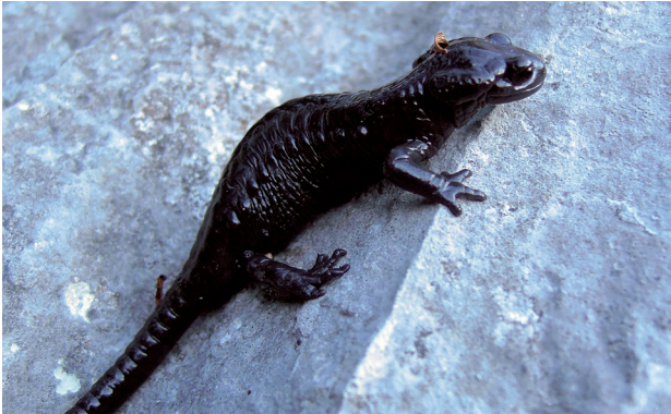
Alpensalamander (K. Zeltner)

Route: Oberstockenalp – Erlenbach i.S. – Thun – Kerzers – Chrümml – Fanel – Broyedamm – Ins