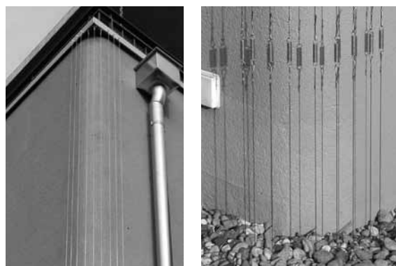
Fig. 3: Cavetti metallici di protezione su parti a rischio della facciata e dettaglio degli elementi di tensione.

A volte i picchi scavano fori anche nelle facciate in legno. Se questi fori presentano una forma arrotondata, 5-8 cm di diametro e il legno in questo punto suona vuoto se vi si picchietta sopra, lo scopo del picchio è probabilmente stato quello di sistemarsi una cavità nel legno o nello spazio vuoto dietro ad esso. Tuttavia, se i punti in cui il picchio ha scavato il legno presentano altre forme, può anche darsi che il picchio vi abbia cercato nutrimento. In questo caso, prima della riparazione, il punto dovrebbe essere esaminato con l'aiuto di un esperto per escludere la presenza di insetti dannosi.