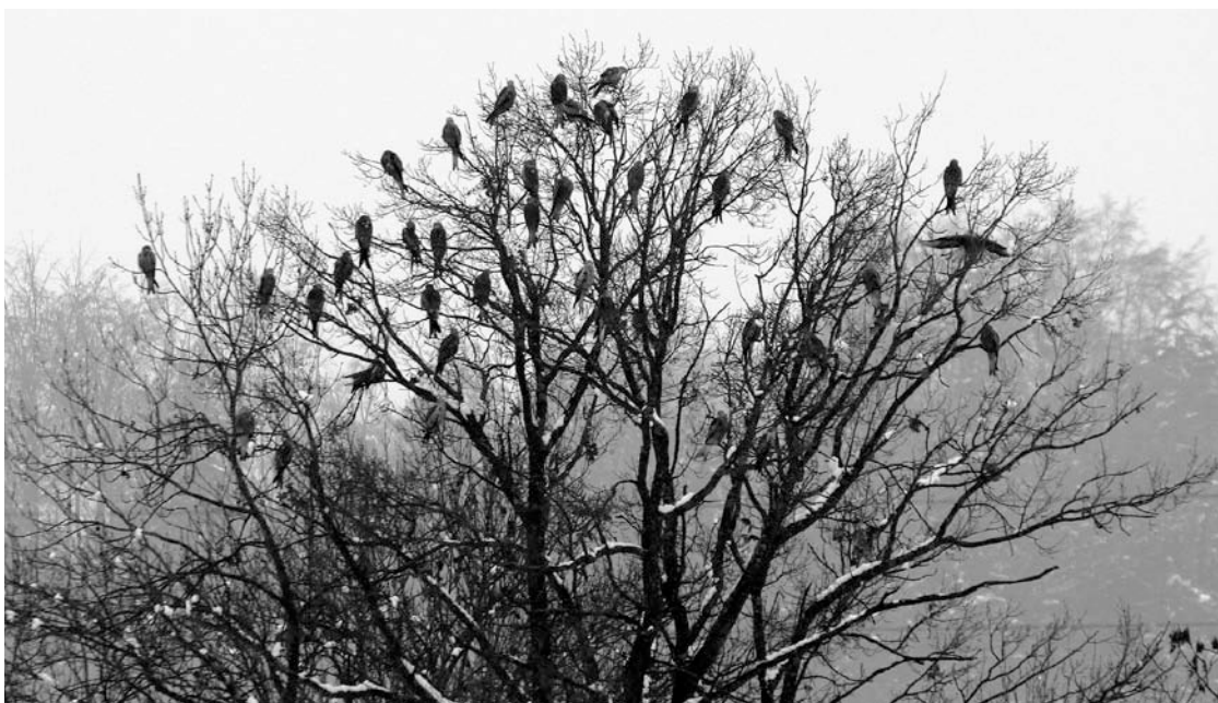
Rotmilan-Schlafplatz im Winter.

Le Milan royal se porte actuellement bien en Suisse. Les exemples est-allemands (intensification de l'agriculture) et du nord-est de la France (rodenticides) montrent cependant que des changements environnementaux peuvent rapidement mener à d'importantes diminutions d'effectifs.