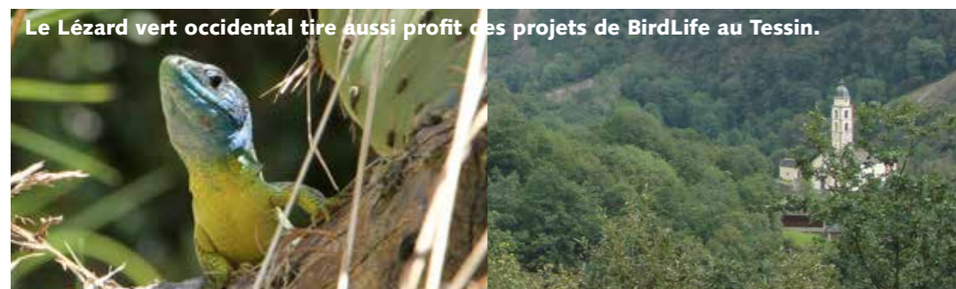
Le Lézard vert occidental tire aussi profit des projets de BirdLife au Tessin.