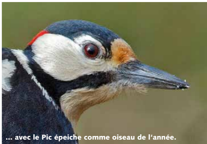
... avec le Pic épeiche comme oiseau de l'année.