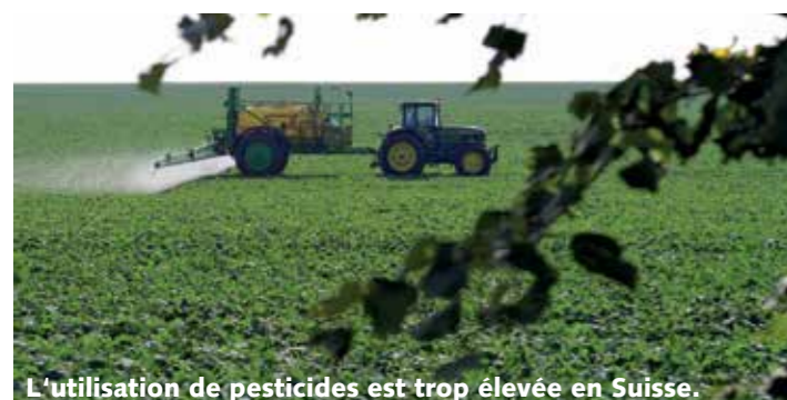
L'utilisation de pesticides est trop élevée en Suisse.

soutenues par BirdLife Suisse et une large coalition d'organisations du milieu agricole, de la santé et des consommateurs. Plus de 100 substances indésirables sont régulièrement détectées dans les eaux. BirdLife Suisse s'engage pour une réduction des pesticides.