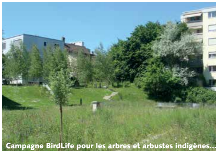
Campagne BirdLife pour les arbres et arbustes indigènes...

de l'année, était l'ambassadeur des arbres et arbustes en milieu construit. Le Plan d'action Biodiversité occupe toujours beaucoup BirdLife Suisse. Le plan d'action en lui-même, pour lequel BirdLife Suisse et ses partenaires s'engagent depuis plus de dix ans, se fait toujours attendre. Mais il a déjà donné un résultat important : en mai, le Conseil fédéral a augmenté les moyens financiers pour la protection de la nature dans les cantons pour la période 2017-2020. Ils doivent être utilisés pour améliorer la qualité des biotopes d'importance nationale, pour la conservation des espèces et pour le renforcement du thème de la biodiversité dans la formation. Un premier pas important !