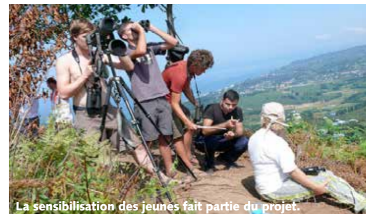
La sensibilisation des jeunes fait partie du projet.