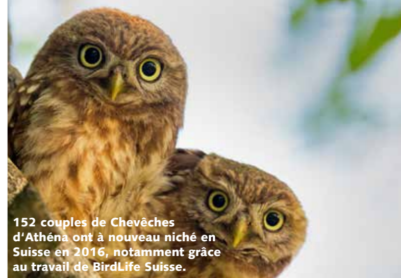
152 couples de Chevêches d'Athéna ont à nouveau niché en Suisse en 2016, notamment grâce au travail de BirdLife Suisse.

est sous pression et pourrait être tué à l'avenir plus facilement qu'aujourd'hui, tout comme d'autres mammifères et oiseaux. BirdLife Suisse s'oppose fortement à ceci et à d'autres points critiques de la révision de la Loi fédérale sur la chasse.