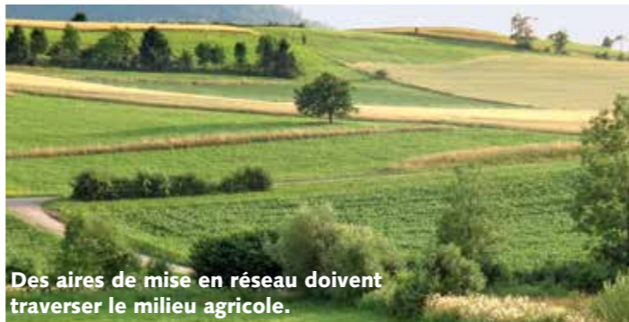
Des aires de mise en réseau doivent traverser le milieu agricole.

fédéral a adopté la mise en place de cette infrastructure écologique en 2012 déjà. Avec sa nouvelle brochure sur l'infrastructure écologique, BirdLife Suisse veut contribuer à sauvegarder les surfaces nécessaires à la nature.