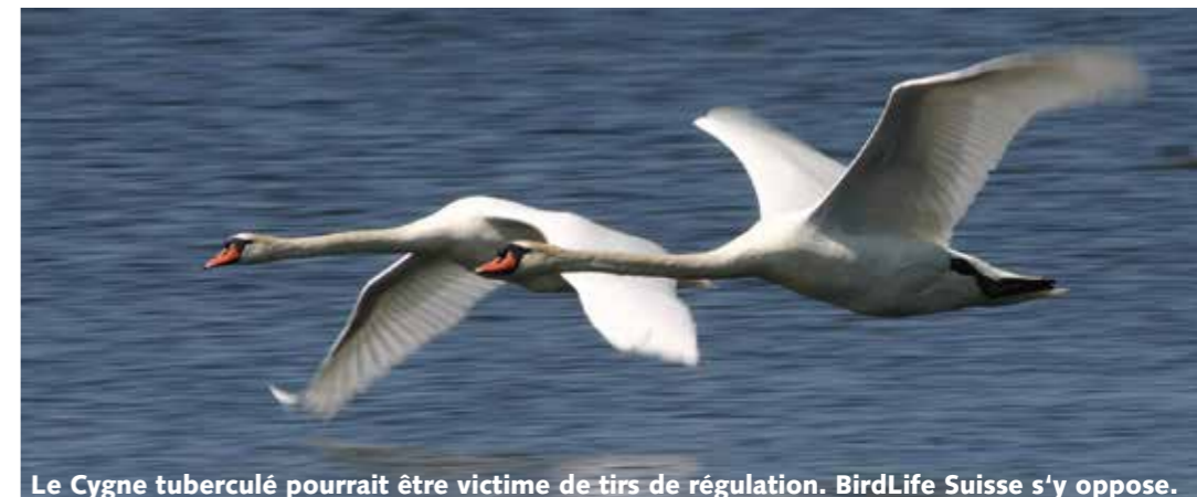
Le Cygne tuberculé pourrait être victime de tirs de régulation. BirdLife Suisse s'y oppose.