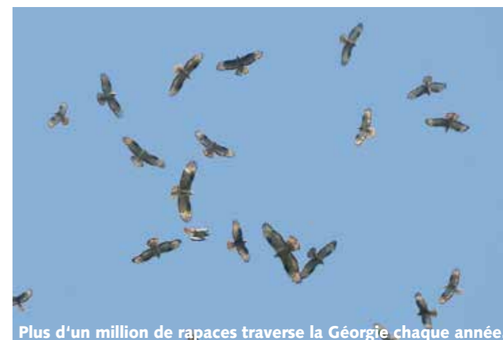
Plus d'un million de rapaces traverse la Géorgie chaque année.

une espèce menacée , occupe encore le sud du Caucase. Un projet de conservation soutenu par la Suisse protège les énormes nids de cet oiseau et crée de nouveaux sites de nidification. Dans l'ouest de la Géorgie au bord de la Mer noire, plus d'un million de rapaces comme des buses, des aigles et des faucons, transite chaque automne. Le comptage de rapaces de Batumi est un projet qui combine de façon exemplaire le suivi de la migration des oiseaux et la sensibilisation à la nature, surtout des jeunes.