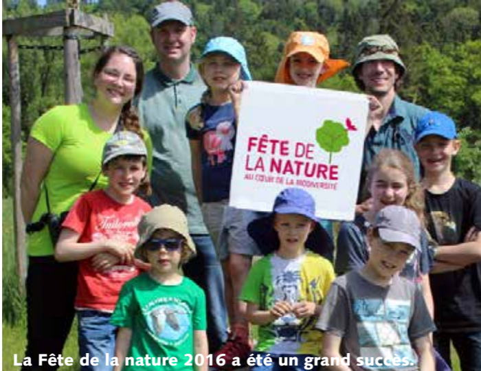
La Fête de la nature 2016 a été un grand succès.

Après des années de succès en Suisse romande, la «Fête de la nature» a eu lieu pour la première fois en 2016 dans toute la Suisse. Cela a été rendu possible grâce à BirdLife Suisse qui a organisé la fête en Suisse alémanique et au Tessin. Environ 30'000 personnes ont été sensibilisées à la nature grâce aux 772 événements organisés fin mai. De nombreuses sorties ont été organisées par des sections locales de BirdLife Suisse. Entretemps, BirdLife Suisse a transmis son rôle d'organisateur à une association constituée à cet effet qui regroupe de nombreuses organisations et coordonnera chaque année la fête de la nature en Suisse allemande et italienne. Une nouvelle exposition temporaire a débuté au