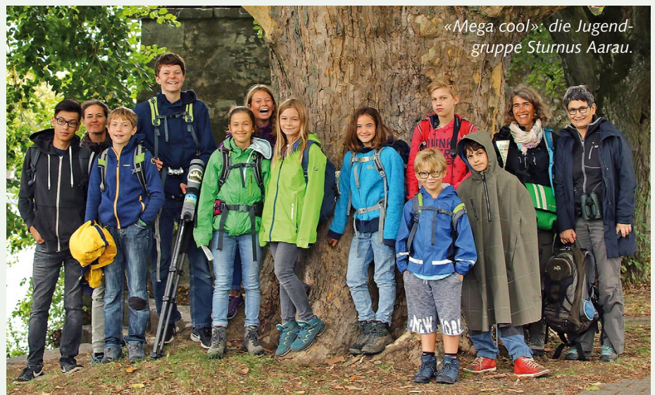
«Mega cool»: die Jugendgruppe Sturnus Aarau.

VM/NM: Ein Highlight war die zweiwöchige Reise nach Marokko für Teilnehmende ab 16 Jahren. Schlussendlich bietet aber jede Exkursion spannende, unerwartete Erlebnisse.