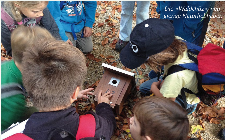
Die «Waldchüz»; neugierige Naturliebhaber.

CW/MS: Uns haben folgende Anlässe gut gefallen: «Holunder tut Wunder» (Geschichten und Mythen zum Holunder, Holundermedizin, Holunderstifteschnitzen), «Naturkosmetik» (Wir stellen Heilsalbe und Lippenpomade her und lernen etwas über die Wirkung von Kräutern) und «Unser Bach» (Welche Qualität hat unser Bachwasser? Was können wir zum Erhalt von saubereren Gewässern beitragen?)