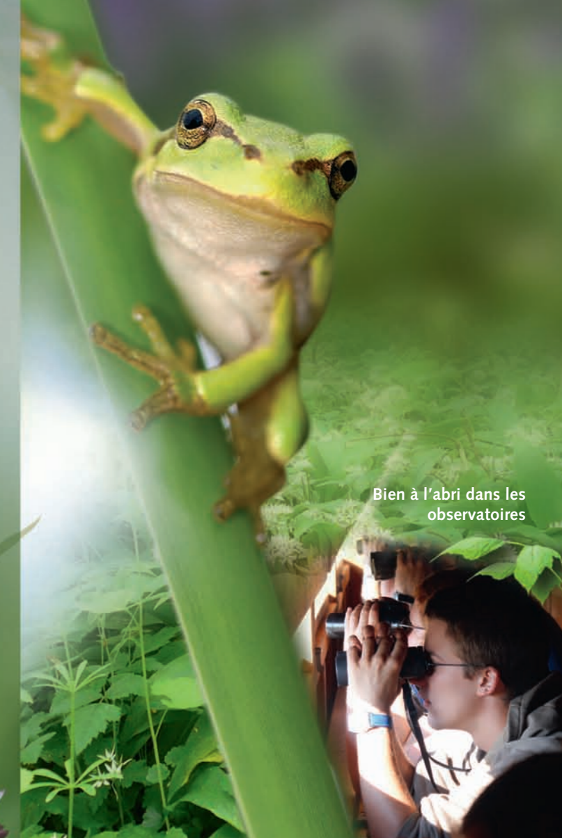
Bien à l'abri dans les observatoires