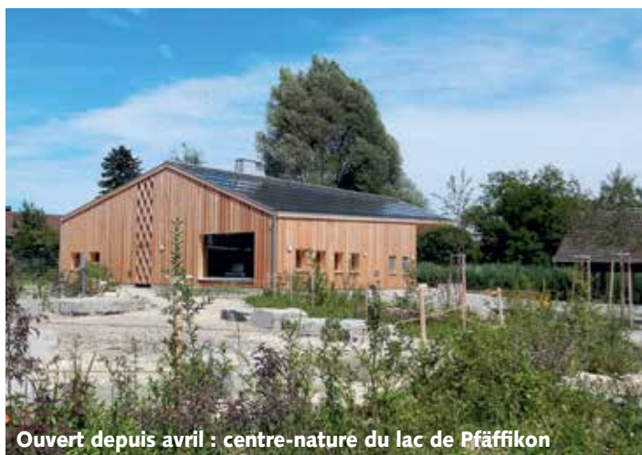
Ouvert depuis avril : centre-nature du lac de Pfäffikon

journée des insectes a réuni plus de 300 personnes intéressées. Avec le slogan « Ensemble pour la biodiversité et le climat », un groupe important de BirdLife a participé le 28 septembre à la grande manifestation pour le climat qui a rassemblé environ 100 000 personnes à Berne.