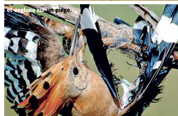
et engluée sur un piège.