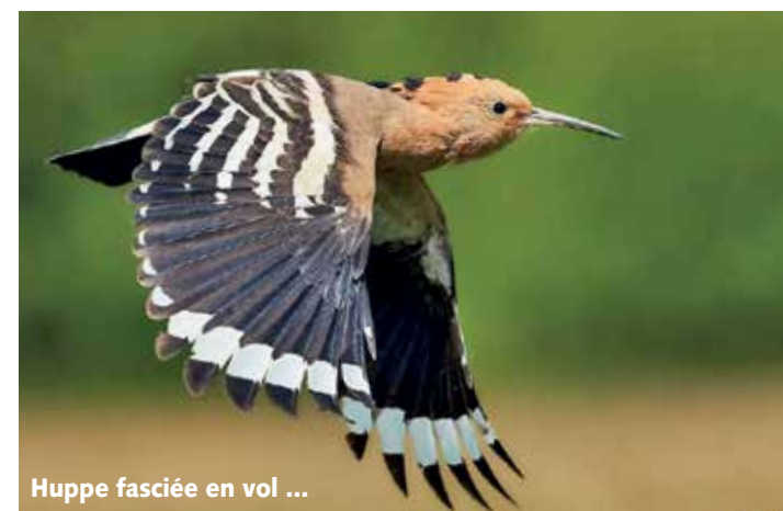
Huppe fasciée en vol ...

chaque année en raison du braconnage. BirdLife Suisse soutient la Lipu/BirdLife Italie dans la mise en place d'un programme anti-braconnage et dans le travail de sensibilisation. A Chypre , et en particulier sur les bases militaires britanniques, les captures au filet par les braconniers ont diminué de 90% depuis 2002. Sans pression de BirdLife Cypré, avec l'aide venue de Suisse, le nombre de captures augmenterait à nouveau rapidement. Et BirdLife Suisse s'engage aussi dans notre pays pour la conservation des sites de nidification des oiseaux migrants, un élément également déterminant.