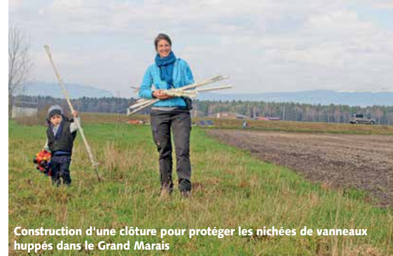
Construction d'une clôture pour protéger les nichées de vanneaux huppés dans le Grand Marais

de BirdLife, l'espèce aurait probablement déjà disparu de Suisse il y a 20 ans. BirdLife Suisse réalise des programmes de conservation pour la chevêche d'Athéna, le torcol fourmilier, les hirondelles de fenêtre et de rivage, le tarier des prés, le bruant proyer et d'autres espèces. La révision de la loi sur la chasse et la protection (LChP), en cours depuis deux ans, a abouti au Parlement à une loi sur la chasse inacceptable . Les organisations environnementales n'avaient donc pas d'autre choix que d'amener cette révision devant le peuple au moyen d'un référendum . La récolte des signatures a été lancée par BirdLife Suisse, le Groupe Loup Suisse, Pro Natura, WWF Suisse et zoosuisse en octobre.