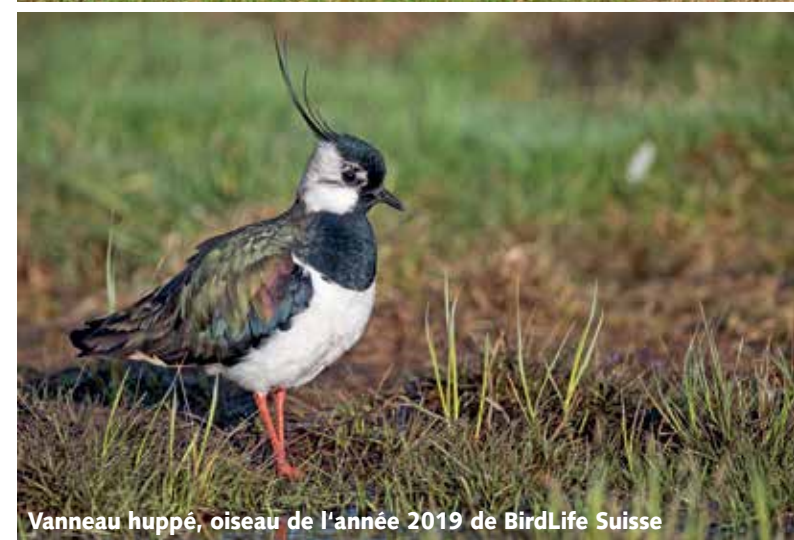
Vanneau huppé, oiseau de l'année 2019 de BirdLife Suisse