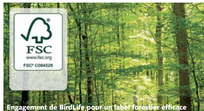
Engagement de BirdLife pour un label forestier efficace

sylviculture proche de la nature prescrite par la loi, le label FSC contribue aussi à la protection de la nature en forêt, car il fixe des standards concrets que les propriétaires forestiers doivent respecter. BirdLife Suisse a intensivement collaboré aux standards FSC pour la Suisse.