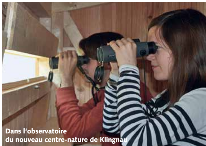
Dans l'observatoire du nouveau centre-nature de Klingnau

Au centre-nature BirdLife de La Sauge , la nouvelle exposition sur le monde des invertébrés aquatiques a débuté.