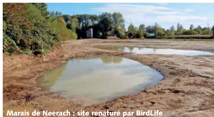
Marais de Neerach : site renaturé par BirdLife

montre l'exemple. Après une renaturation de 3,5 ha en bordure de marais il y a quelques temps, un hectare supplémentaire a pu être ajouté cet automne avec la création d'étangs peu profonds et de surfaces maigres.