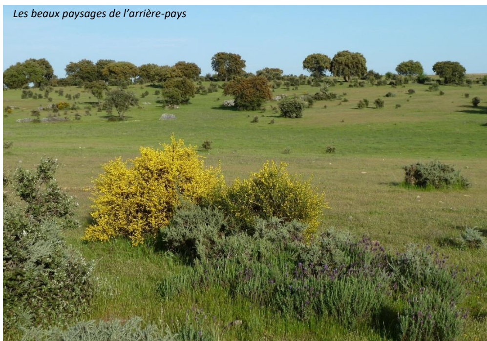
Les beaux paysages de l'arrière-pays

En plus de l'observation d'oiseaux de première classe dans des paysages magnifiques, ce voyage offre en principe beaucoup de soleil et la possibilité de goûter un peu de la culture portugaise, des vins délicieux, le porto et la cuisine locale.