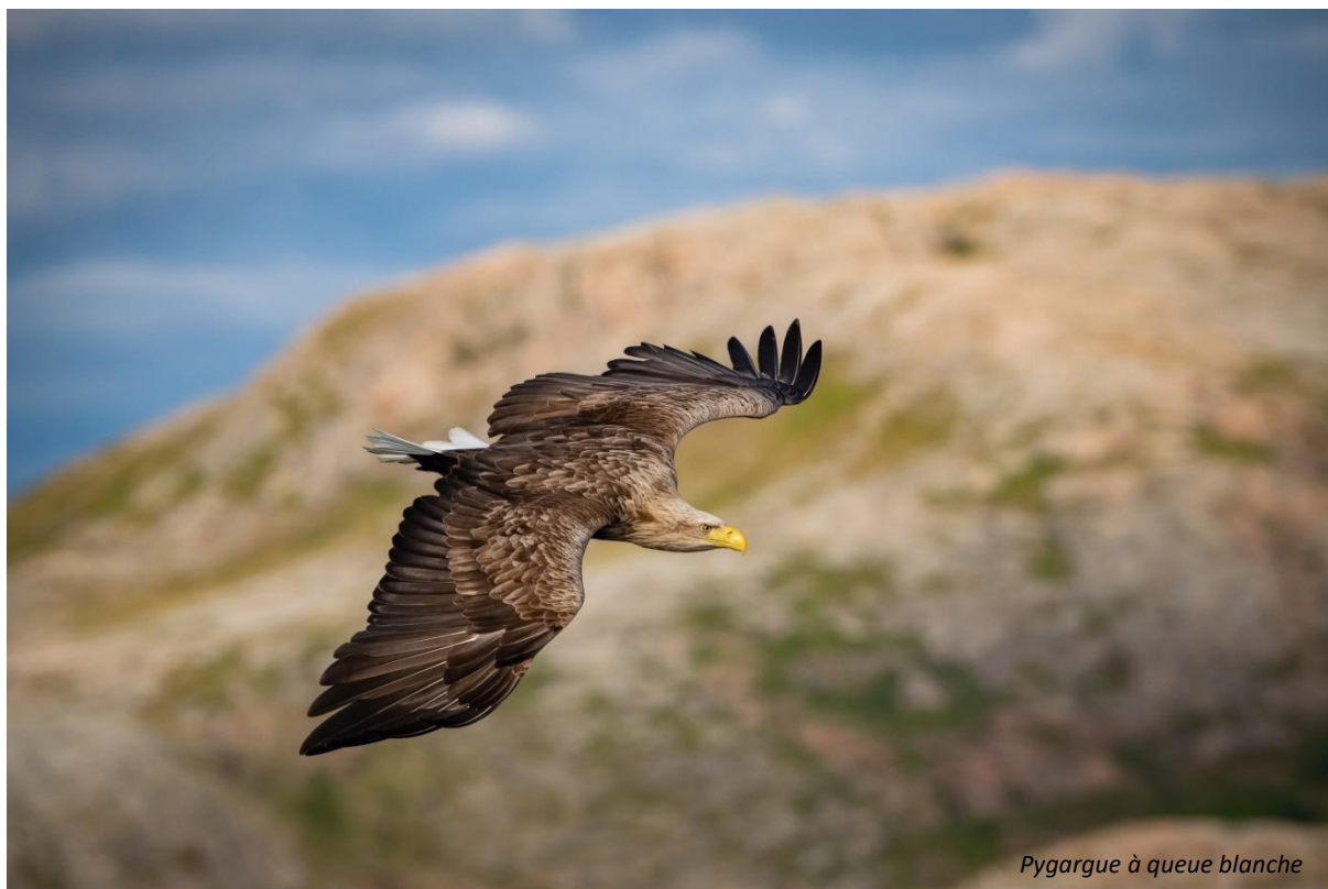
Pygargue à queue blanche

Prix par personne : CHF 2'075.- (supplément chambre individuelle : CHF 350.-)