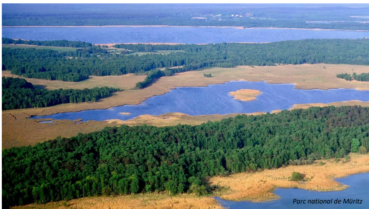
Parc national de Müritz

Le parc national de Müritz est composé d'une mosaïque de lacs, d'étangs, de forêts, de prairies extensives et de dunes. Il héberge une bonne population de balbuzards, de pygargues et de milans royaux. Nous rechercherons également quelques spécialités comme l'aigle pomarin, la fauvette épervière et le roselin cramoi. De bonnes possibilités d'écoute matinale des oiseaux nous seront offertes.