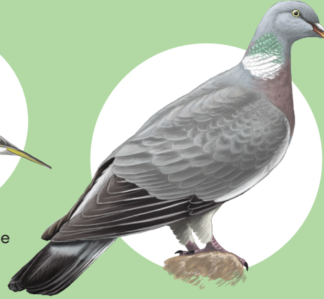
4 Pigeon ramier