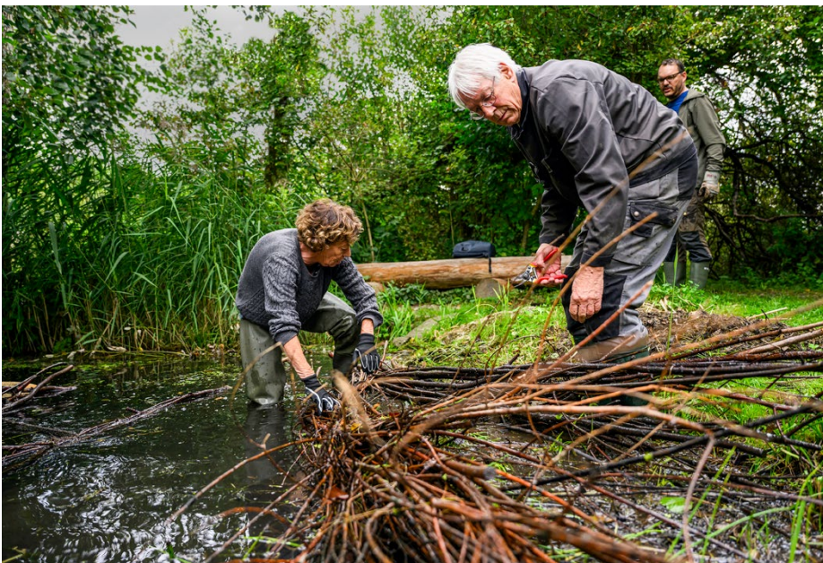
Bei Münchenbuchsee entstanden Biberdämme von Menschenhand.