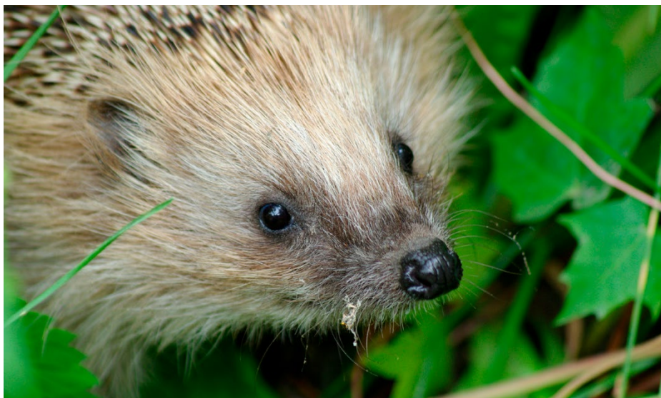
Mehr Natur im Siedlungsraum dient vielen Arten – auch dem Igel.