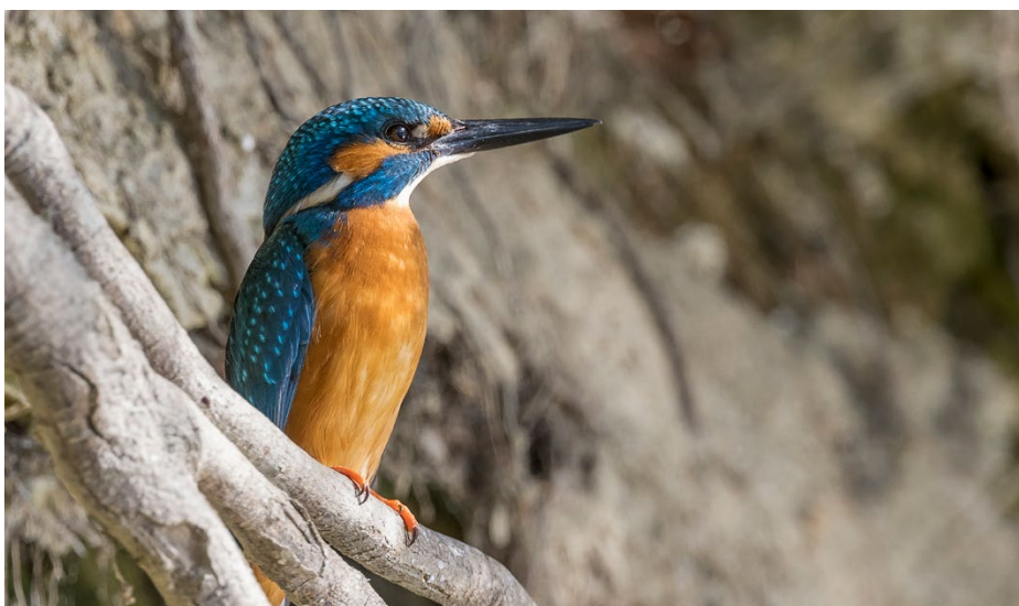
Der beste Eisvogelschutz ist Lebensraumschutz.

Der Eisvogel benötigt ein Netz an Still- und Fliessgewässern, um jederzeit genug Nahrung und einen Brutplatz zu finden. Die BirdLife-Naturschutzvereine können den Schillervogel in geeigneten Gebieten fördern; BirdLife Schweiz unterstützt sie dabei gerne. Beobachten lässt sich der Eisvogel besonders gut in den BirdLife-Naturzentren.