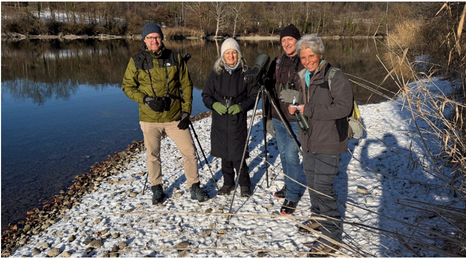
In Rothrist kann die Bevölkerung dieses Jahr alle Vogelsichtungen melden. © Beat Rüeegger