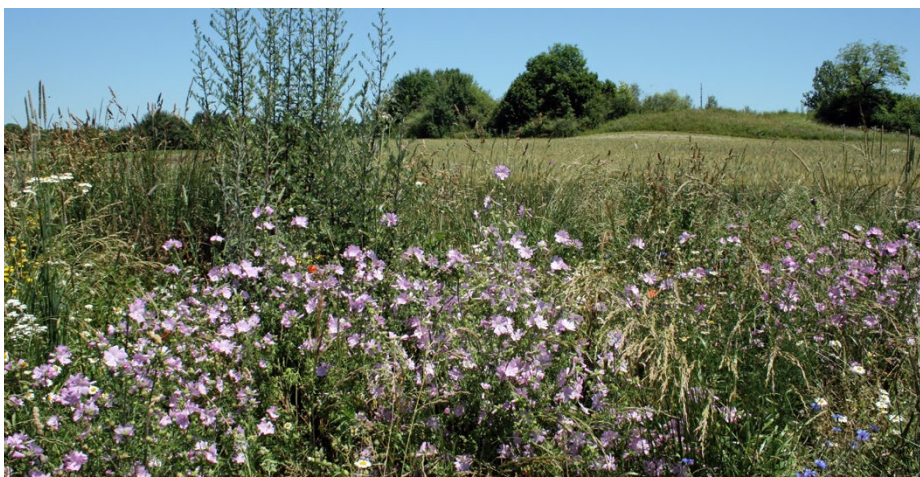
Welche Massnahme macht wo Sinn? ReVerde berät die Betriebe.

Landwirtschaftliche Produktion und Förderung der Biodiversität muss sich jedoch keineswegs ausschliessen, sondern kann im Gegenteil Hand in Hand gehen, wie z. B. das BirdLife-Projekt Farnsberg beweist. Dort werden die teilnehmenden Landwirtinnen und Landwirte umfassend beraten, damit sich die Fördermass-