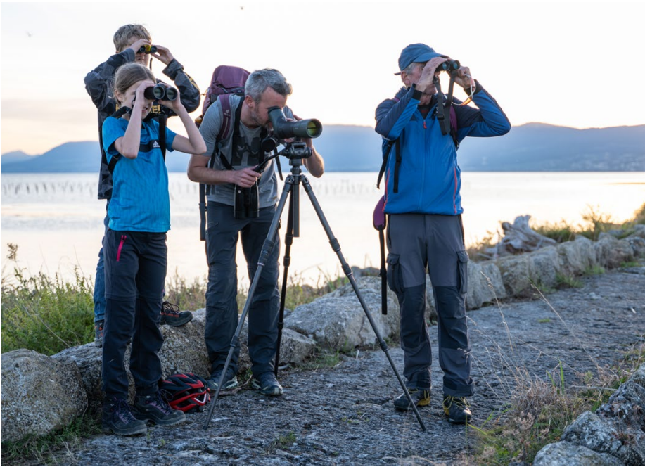
Spass und Spannung: Das ist das Bird Race.