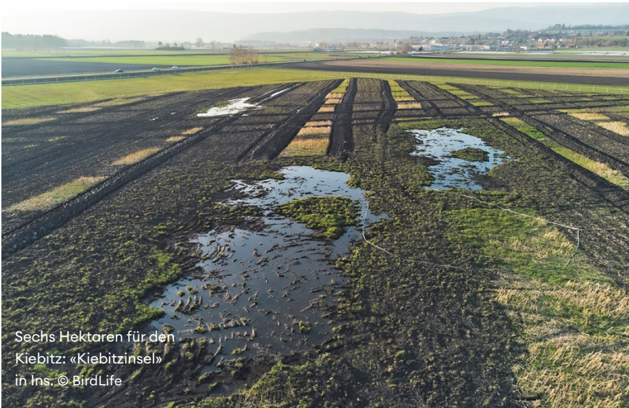
Sechs Hektaren für den Kiebitz: «Kiebitzinsel» in Ins.