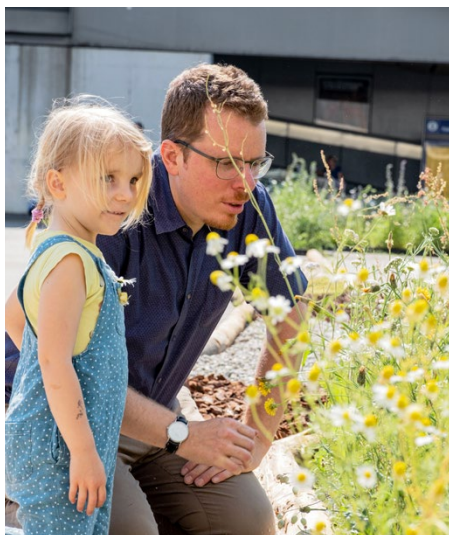
Natur erleben – mitten in Basel.

Vom 3. bis 6. September 2026 lassen wir in Basel wieder gemeinsam den Meret Oppenheim-Platz mit einer Blumenwiese erblühen. Die erfolgreiche Zusammenarbeit von Basler Kantonalbank BKB und BirdLife Schweiz für mehr Biodiversität in Basel wird für drei Jahre fortgeführt.