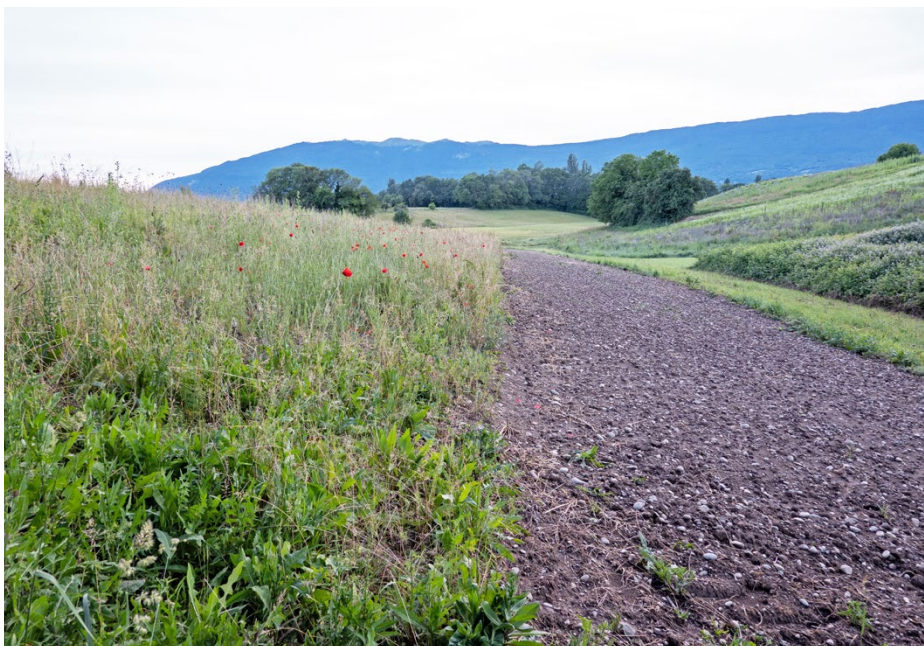
Neue Nahrungsflächen für die Turteltaube in der Champagne genevoise.

Mit gezielten Massnahmen für mehr Feuchtgebiete, Biodiversitätsförderflächen und Gehölzstrukturen stärkt ein neues BirdLife-Programm die Vogelvielfalt im Kanton Genf. Die ersten Aufwertungen kommen bereits bedrohten Arten wie Grauammer, Turteltaube und Steinkauz zugute.