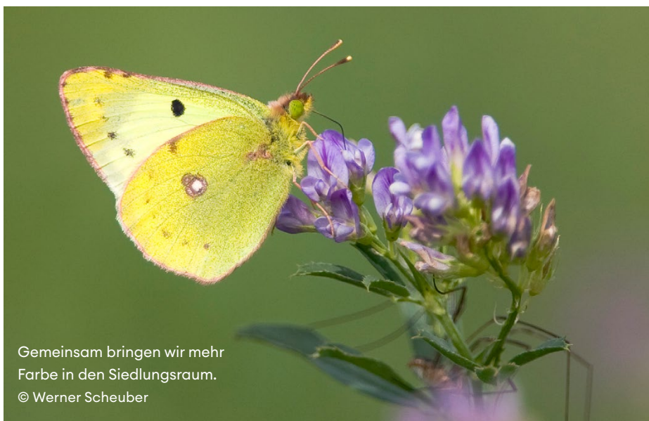
Gemeinsam bringen wir mehr Farbe in den Siedlungsraum.