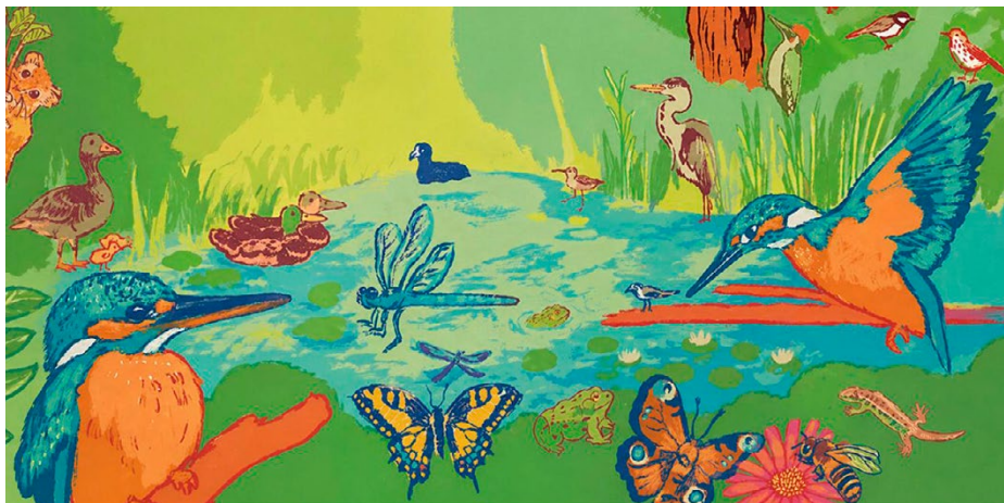
In La Sauge kann die Biodiversität entdeckt werden.

sern, neue pädagogische Instrumente entwickeln und generell den tausenden Besucherinnen und Besuchern sowie Schülerinnen und Schülern, die jedes Jahr das Zentrum betreten, ein noch bereichernderes Erlebnis bieten.