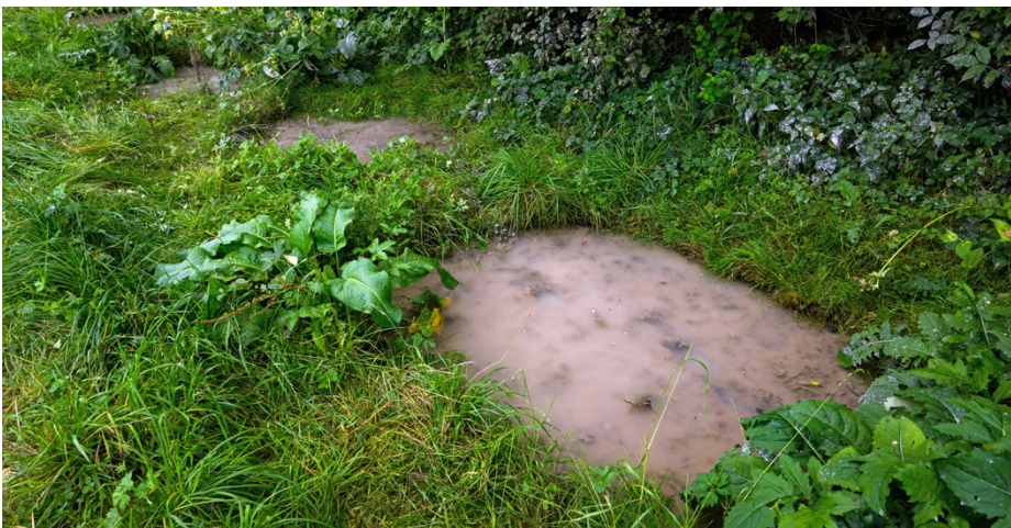
Die kleinen Lehmtümpel entlang eines Feldweges werden gerne von den Unken angenommen. Oben: Wiedervernässung einer Wiese oberhalb der Tümpel.