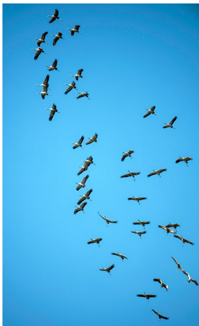
Kraniche auf dem Zug.