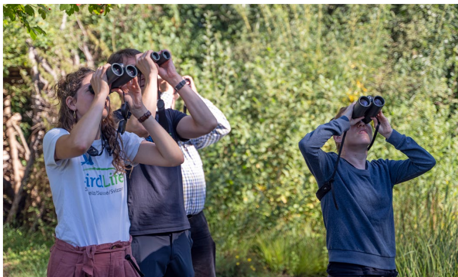
Eine Art zählt, wenn drei von vier Teammitgliedern sie gesehen oder gehört haben.