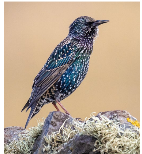
Eines von tausenden Bildern: Star.

Die Bilddatenbank ist nur eine von zahlreichen Dienstleistungen für die BirdLife-Mitgliedorganisationen. Andere sind das Angebot «Web-to-Print» für