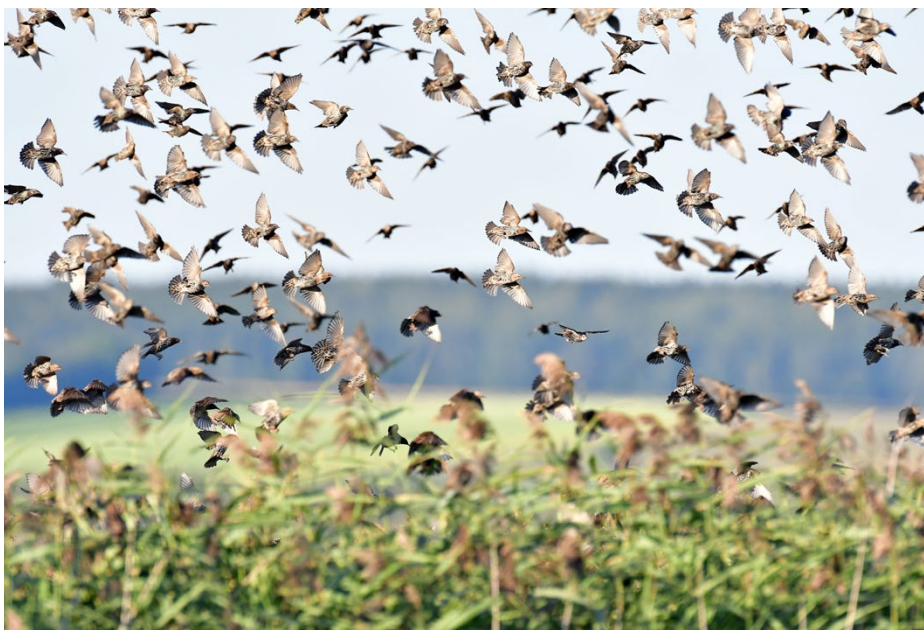
Anfangs Oktober ziehen hunderttausende Zugvögel übers Land.