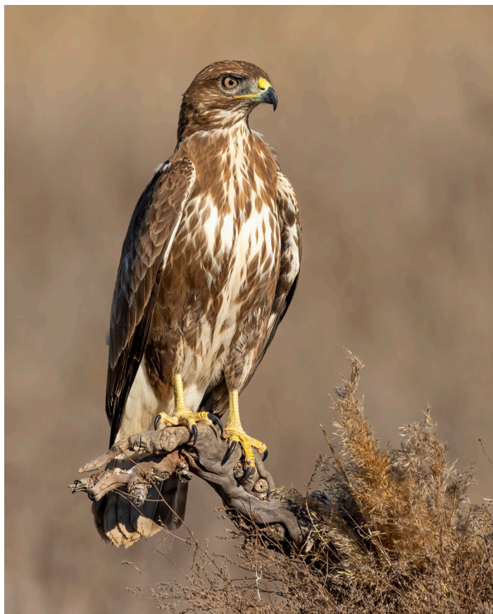
Le poiane sono cacciatrici all'aspetto: stanno posate in punti elevati, aspettando da lì di individuare le loro prede.