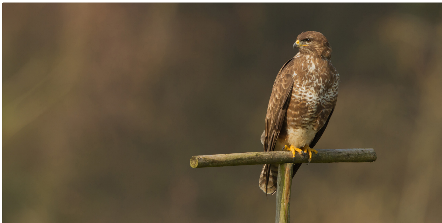
Poiana © Patrick Donini