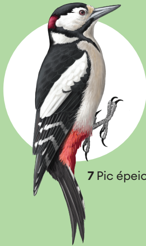
7 Pic épeiche