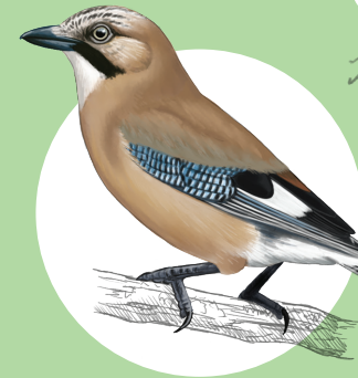
19 Geai des chênes