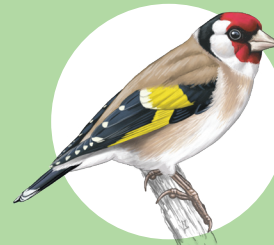
9 Chardonneret élégant