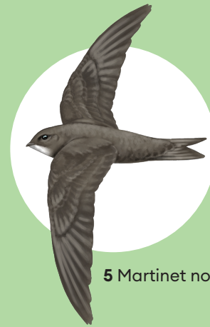
5 Martinet noir