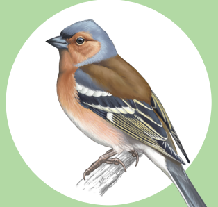
12 Pinson des arbres