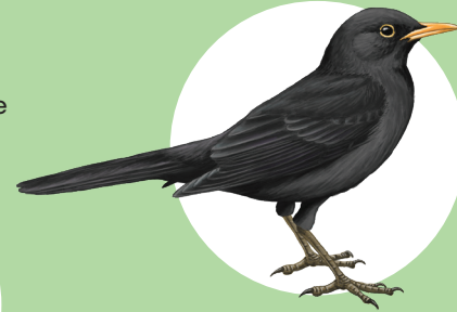
15 Merle noir