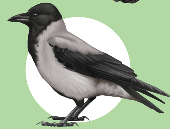
16 Cornacchia grigia