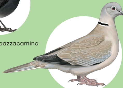
3 Tortora dal collare