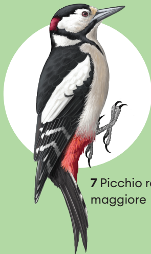
7 Picchio rosso maggiore