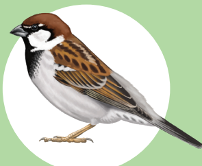
18 Passera d'Italia