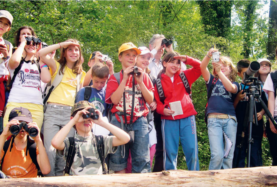
Groupe de jeunes de BirdLife en excursion.

« Depuis mes 10 ans, j'observe les oiseaux et cela fait presque autant de temps que je fais partie du groupe de jeunes Natrix. D'abord comme participante, puis comme monitrice et maintenant en tant que présidente. Echanger avec des personnes partageant les mêmes idées, c'est-à-dire des passionnés de nature motivés, est très stimulant. De nombreux jeunes participent aux camps et se rencontrent pour des excursions. Plusieurs équipes issues du groupe Natrix participent chaque année à l'EuroBirdwatch et à la Bird Race. »