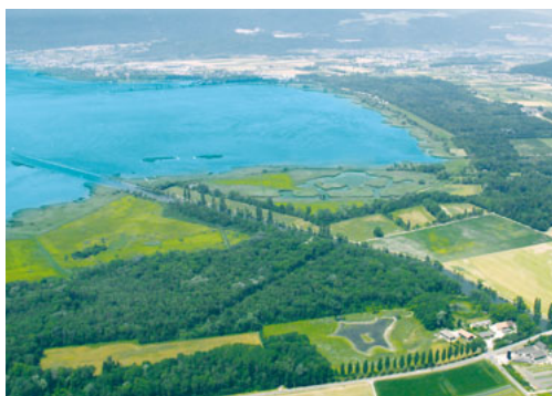
Une mosaïque de milieux naturels : Fanel, réserve de Cudrefin et le site de La Sauge.

Pionniers de l'entretien des sites protégés Le site de La Sauge est un exemple de nos activités dans les sites protégés. A côté du travail d'éducation à la nature mené par le Centre-nature BirdLife de La Sauge, la Fondation Schnorf, propriétaire du terrain, a confié à BirdLife la gestion de surfaces humides, de lisières forestières et d'habitats ouverts.