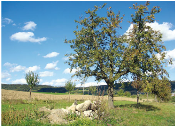
Les petites structures créent des habitats.

Le Farnsberg revit Les succès obtenus dans les vergers de Farnsberg dans le Jura tabulaire de Bâle-Campagne montrent l'efficacité des interventions sur le terrain de BirdLife Suisse. Depuis 2004, de nombreuses surfaces de promotion de la biodiversité y ont été instaurées et revalorisées, en collaboration étroite avec une trentaine d'agriculteurs, des sections locales de protection de la nature et le Centre agricole Ebenrain. La revalorisation du paysage avec notamment des arbres à haute tige, des tas de branches et de pierres et des haies épineuses accompagnées de leurs