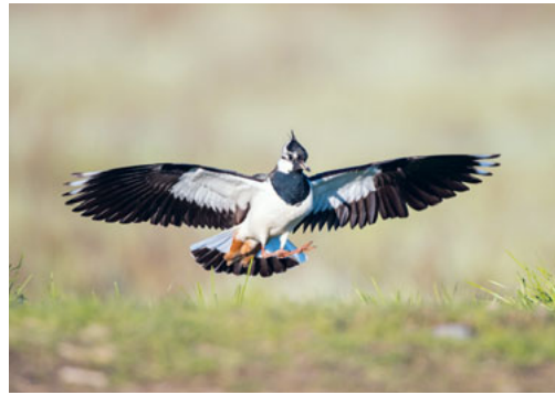
La Pavoncella approfitta delle misure di conservazione.

menti e temporanei offre un habitat supplementare a numerose specie minacciate come la Raganella, che vi si è di nuovo installata. Altri punti forti sono la gestione differenziata dei siti protetti sulla base delle specie bersaglio e la sensibilizzazione del pubblico. BirdLife ha introdotto in Svizzera i primi capanni moderni e creato la rete dei centri natura.